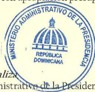
José Ignacio Paliza Ministro Administrativo de la Presidencia